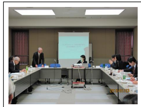
経済産業省との意見交換